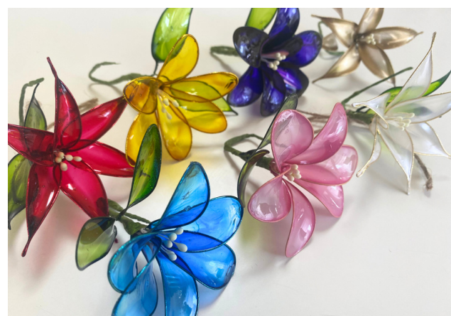
ディップアートフラワー